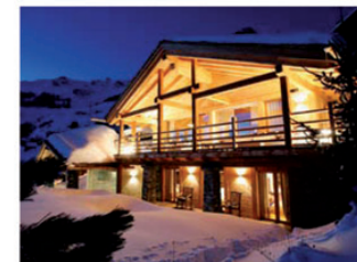
Wenige Minuten vom Zentrum und von den Skipisten entfernt, schmiegt sich das Chalet Spa Verbier in die Winterwelt der Walliser Alpen. Die Badezimmer sind mit Regendusche und hinterem Spiegel verborgenem Flachbildfernseher ausgestattet.