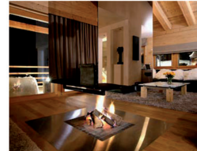
Blickfang im Wohnzimmer ist die offene Feuerstelle, die Wohn- und Essbereich optisch voneinander trennt.

Dass es dem Gast an nichts fehlt, dafür sorgen Personal Trainer, Küchenchef, Concierge und mehrere Therapeuten, die jeden Wunsch von den Augen ablesen. Der Fünf-Sterne-Service ist ausgesprochen persönlich umsorgend und serviert beispielsweise Ski-Gourmets feinste kulinarische Freuden nach individuellen Vorlieben direkt an