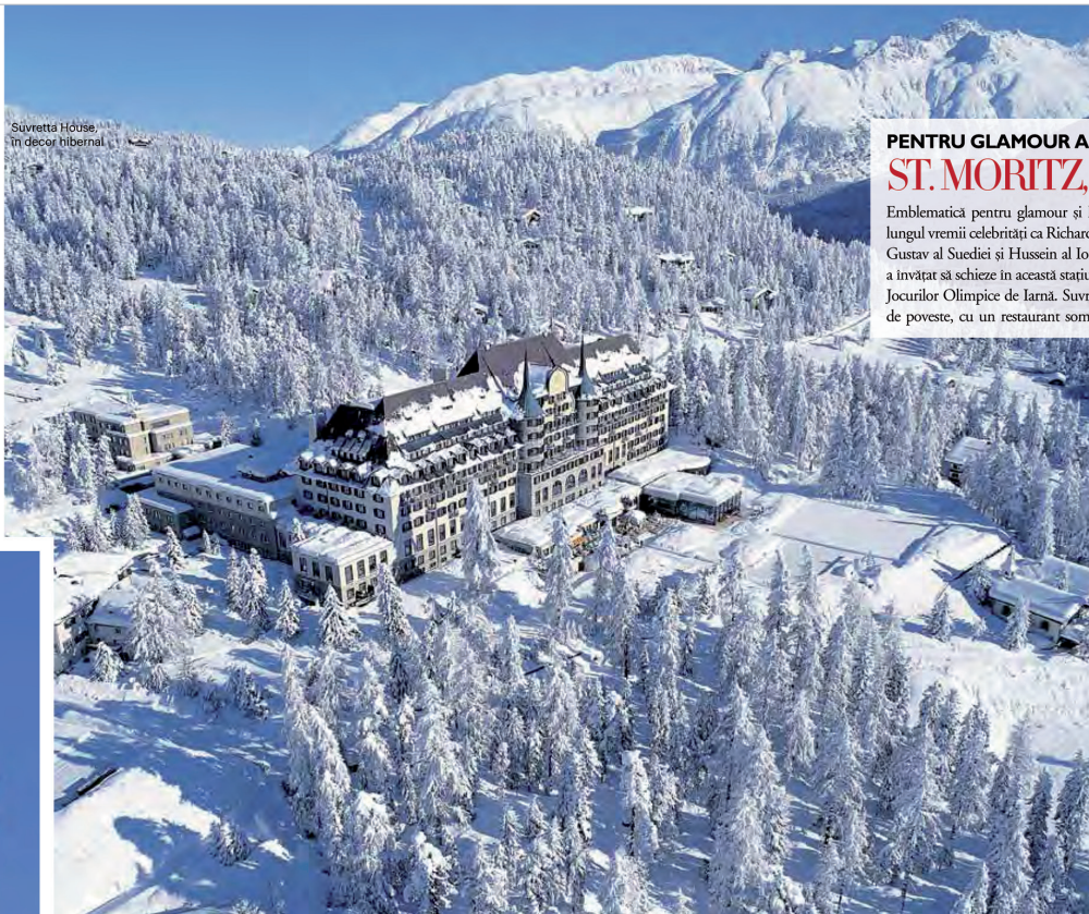
Suvretta House, în decor hibernal

Hotel Mont Cervin Palace, de la 565 euro/cameră/noapte; montcervinzermatt.com