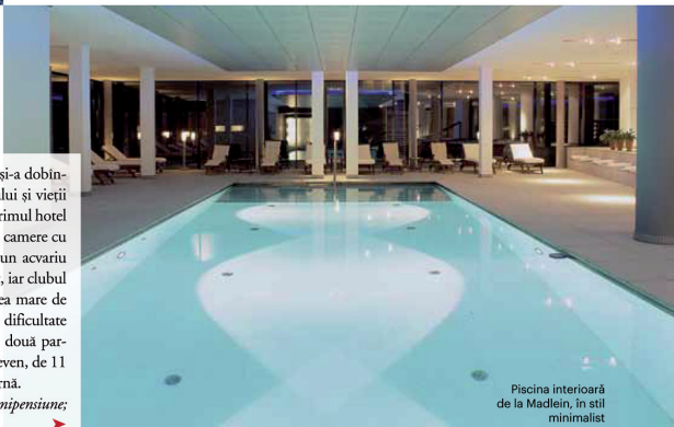
Piscina interioară de la Madlein, în stil minimalist

Chalet Spa Verbier, 50.000 franci elvețieni/săptămînal/10 pers.; chaletspa.com