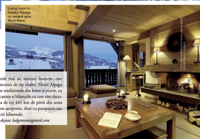
Living room în hotelul Alpaga, cu vedere spre Mont Blanc

Hotel Alpaga, de la 365 euro/cameră/noapte, cu mic dejun; lodgumontagnard.com