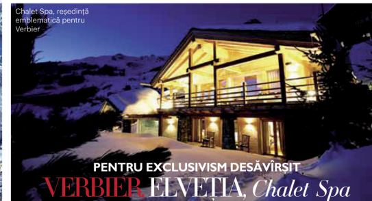
Chalet Spa, reședință emblematică pentru Verbier

Hotel Madlein, de la 190 euro/noapte/pers., cu demipensiune; madlein.com