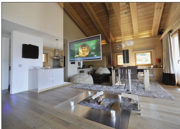
Au centre du séjour, une cheminée au sol. Invisible une fois éteinte, la télévision-miroir est encadrée dans le manteau.