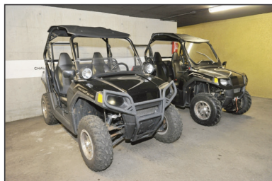
Compris dans la location: deux quads, une limousine Mercedes avec chauffeur, des vélos, mais pas la Lamborghini du propriétaire.