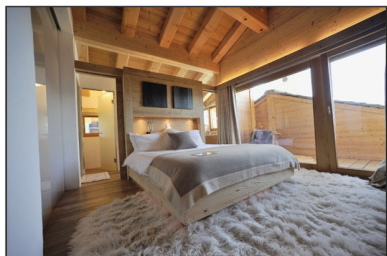
La «master room», avec douche, baignoire, cheminée, télévision, dressing-room. Une des cinq chambres du chalet.