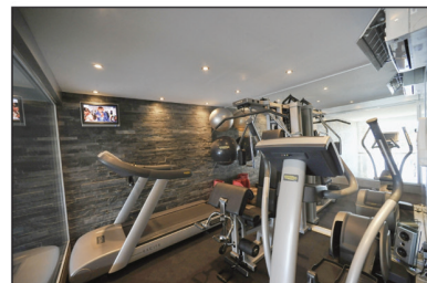
La salle de fitness comprend plusieurs écrans de télévision, dont certains encadrés directement sur les machines à transpirer.