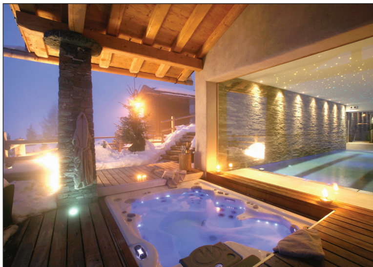
Un jacuzzi géant placé sur une terrasse. Avec musique et télévision waterproof.

Cette domotique profite des connaissances informatiques de Simnet S.A. Lorsque vous appuyez sur un bouton entrant