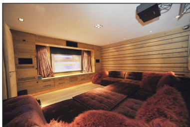
La salle de cinéma n'a pas été voulue surdimensionnée. Mais elle est truffée d'électronique et insonorisée.