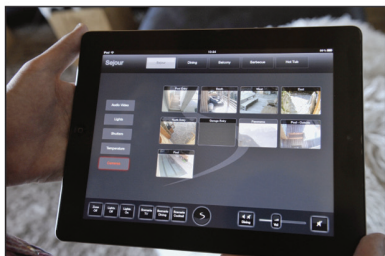
Chaque iPad permet de commander stores, TV, lumières, musique. Mais aussi de surveiller le chalet via des caméras donnant sur l'extérieur et l'intérieur.